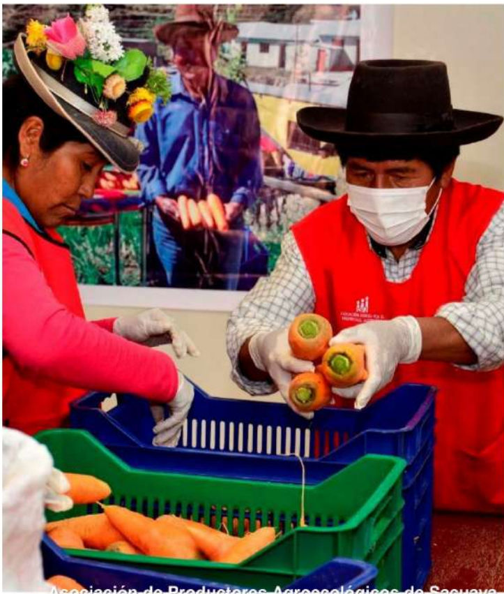
Asociación de Productores Agroecológicos de Sacuaya